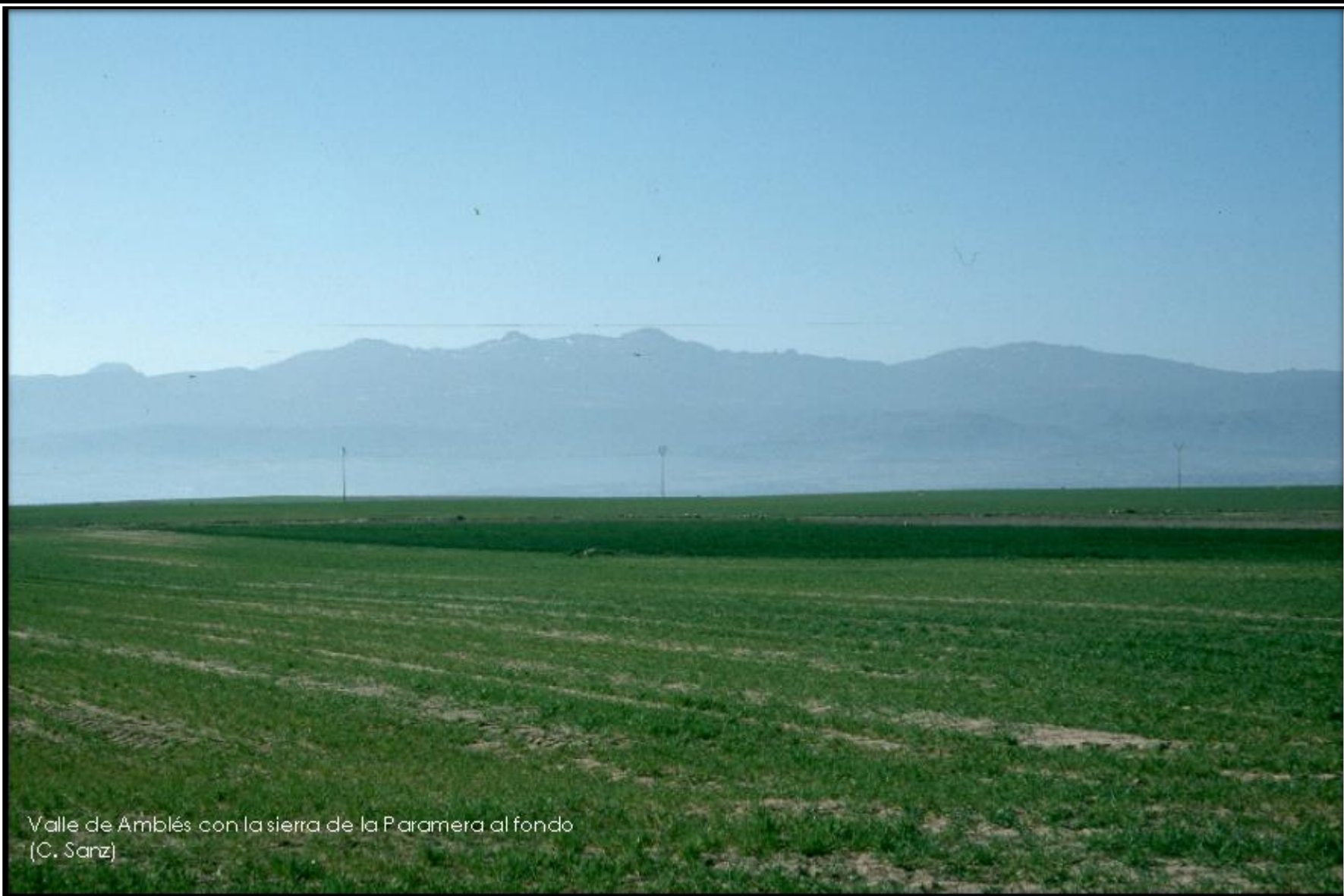
Valle de Amblés con la sierra de la Paramera al fondo (C. Sanz)